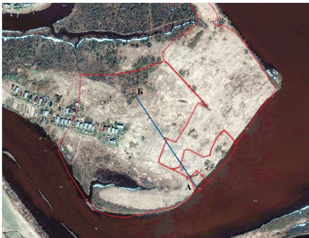
Рис. 1. Местоположение почвенно-геоморфологического профиля (линия А–Б) на космоснимке современного ландшафта вторичного луга. Контур угодий вычерчен на основе плана землепользования 1980-х годов. Масштаб: в 1 см 122 м

Результаты и обсуждение. Трансекта прошла через бывшие колхозные поля, частные огороды и не затронутые пахотой луговые участки (рис. 1). Площади частных огородов составляли 0,3–0,8 га, колхозных полей – до 20 га, при этом угодья были заброшены в разное время. Самый ранний участок залежи заброшен около 50 лет назад (в конце профиля у протоки) и в настоящее время представлен заочкаренной, заболоченной, заросшей ивой местностью в понижении рельефа. На остальной части трассы рельеф повышен, отличается перепадами микро- и нанорельефа в пределах 1 м. В почвенно-геоморфологическом профиле присутствуют естественные понижения и